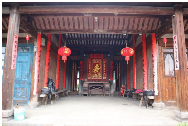
图 1 沙县水美村双元堡祖堂

闽中土堡的语义符号体系是一套植根于地域特质、历史传承与社会信仰的复杂文化编码系统。它通过空间布局、装饰符号、仪式活动及建筑功能，呈现出独特的地方性认同与集体记忆 [5] 。在空间布局维度上，闽中土堡通常采用封闭的建筑结构，围绕中心公共空间展开，以“中轴对称”的理念体现传统礼制与社会等级秩序 [6] 。这种空间布局既体现了“天人合一”的哲学思想，也强化了家族共同体的凝聚力与归属感 [7] 。土堡中心的祠堂或宗庙不仅用于祭祀祖先，更是族群内部协调事务和决策治理的核心场所，体现出明显的社会治理符号意涵。